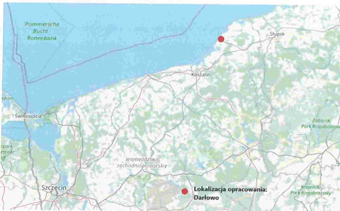
Ryc.1. Lokalizacja opracowania na tle województwa zachodniopomorskiego

Dla analizowanego terenu obowiązuje plan zagospodarowania przestrzennego, uchwalony przez Radę Miejską w Darłowie w 2007 roku: