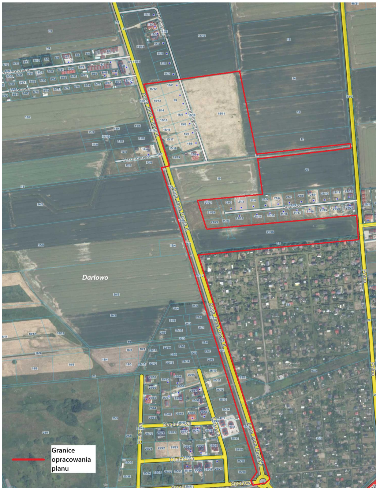
Ryc.2. Aktualny stan zagospodarowania obszaru opracowania

Dla obszaru objętego planem opracowane zostały ogólne zagadnienia fizjograficzne w Opracowaniu ekofizjograficznym.