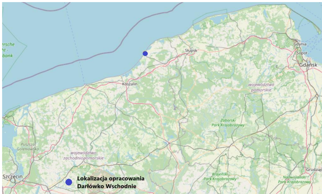
Ryc.1. Lokalizacja opracowania na tle województwa zachodniopomorskiego

Dla analizowanego terenu obowiązuje plan zagospodarowania przestrzennego, uchwalony przez Radę Miejską w Darłowie w 2007 roku: Uchwała Nr IV/34/07 z dnia 6.02.2007 r. w sprawie uchwalenia miejscowego planu zagospodarowania przestrzennego dla jednostki strukturalnej C – Darłowo Wschodnie położonej na obszarze Gminy Miasto Darłowo (Dz. Urz. Województwa Zachodniopomorskiego nr 38 z 26.03.2007 r. poz. 558) oraz Studium uwarunkowań i kierunków zagospodarowania przestrzennego Gminy Miasto Darłowo którego ustalenia są spójne z analizowanym opracowaniem planistycznym. Opracowywany plan zagospodarowania przestrzennego ma charakter dokumentu planistycznego, w którym określone zostaną zasady zagospodarowania. Plan zagospodarowania przestrzennego będzie aktem prawa miejscowego, na bazie którego będzie dokonywać się lokalizacji inwestycji. W obszarze opracowania plan wprowadza zmiany dotychczas obowiązujących funkcji – tj. część terenów o dotychczasowym przeznaczeniu rolniczym i zieleni izolacyjnej przeznaczają na tereny usług turystyki, tereny zabudowy mieszkaniowej jednorodzinnej z usługami zachowują swoją funkcję. Zmiana planu jest zgodna z oczekiwaniami i wnioskami właścicieli terenów.