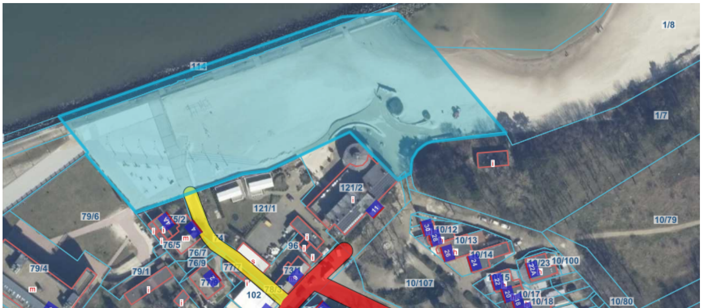
Rys. nr 2 - ortofotomapa terenu, który miałby być wyłączony z krajobrazu priorytetowego kod 32-313.47-24

Przyczyną wniosku o wyłączenie powyższego terenu jest fakt istniejącej drewnianej spacerowej promenady na falochronie. Zapisy kierunków i zasad kształtowania zabudowy, zagospodarowania i użytkowania terenu z audytu krajobrazowego ograniczy lub nawet uniemożliwi remont, przebudowę lub inne roboty związane z utrzymaniem przedmiotowej promenady, która jest wkomponowana w budowlę hydrotechniczną- opaskę brzegową, stanowiącą element systemu ochrony brzegu morskiego.