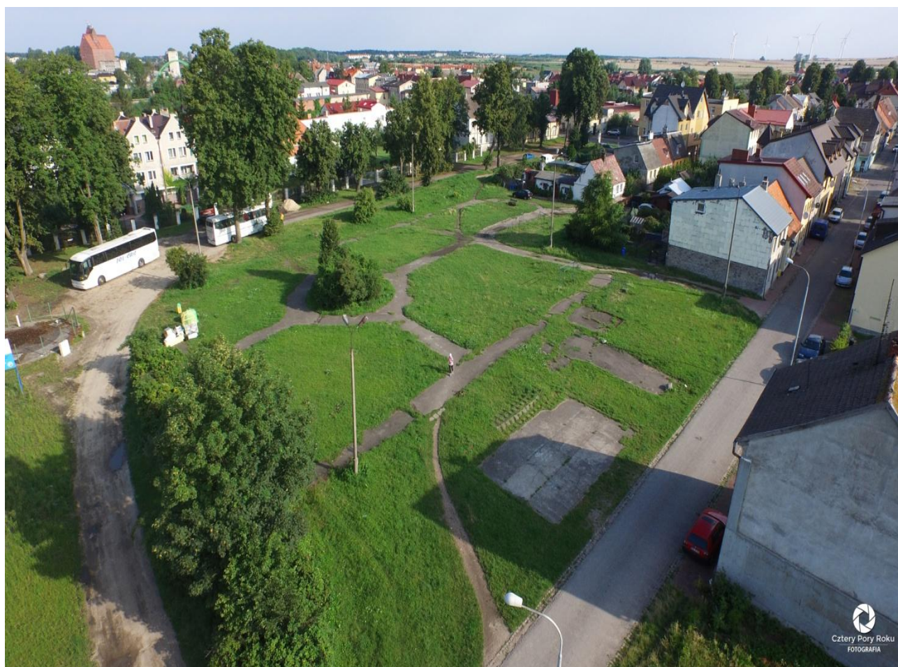
Zdjęcie nr 3. Teren parku nie zagospodarowany przy ul. Traugutta.