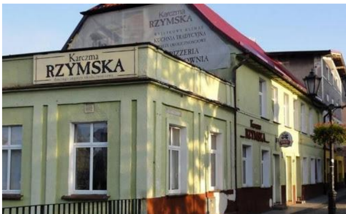
Zdjęcie nr 14. Kamienica usługowo-mieszkalna przed odnowieniem elewacji.