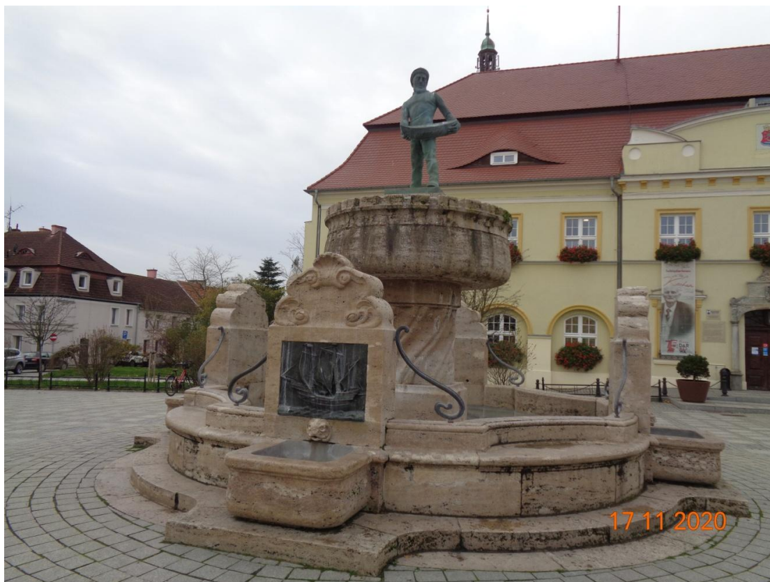
Zdjęcie nr 6. Pomnik rybaka po wykonaniu prac konserwatorskich.