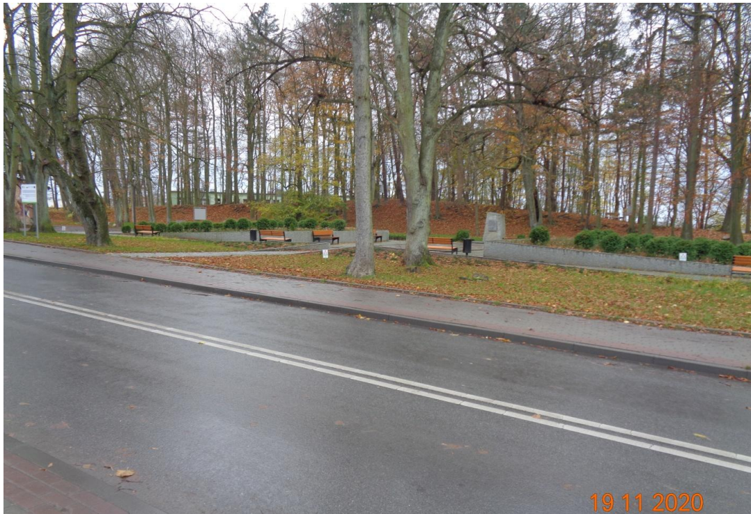
Zdjęcie nr 8. Zakończone prace nad odnową terenów zielonych w tym Park Króla Eryka w Darłowie.