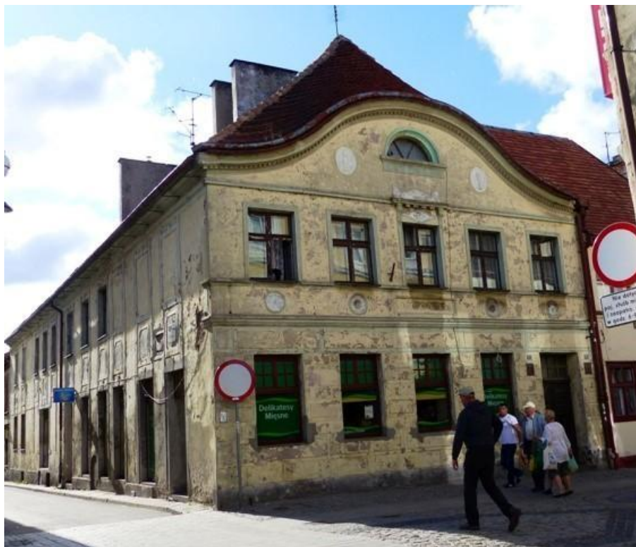
Zdjęcie nr 10. Kamienica „Pod Kogą” przed pracami konserwatorskimi.