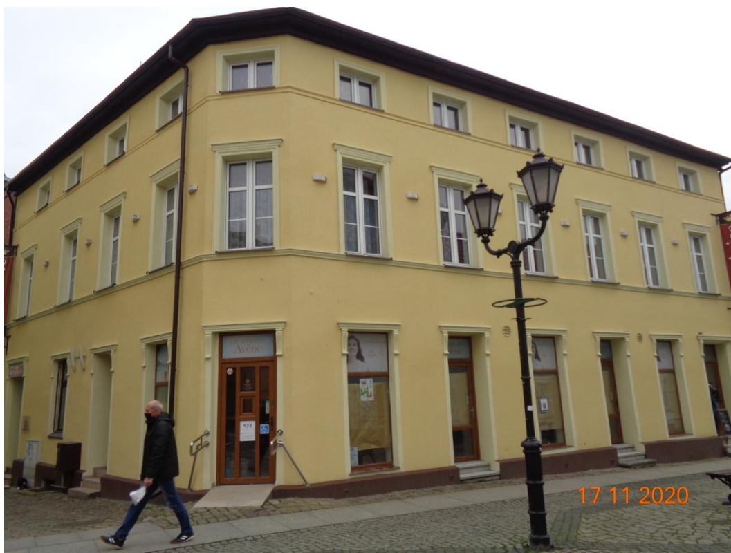
Zdjęcie nr 17. Kamienica Powstańców Warszawskich 27 po odnowieniu.