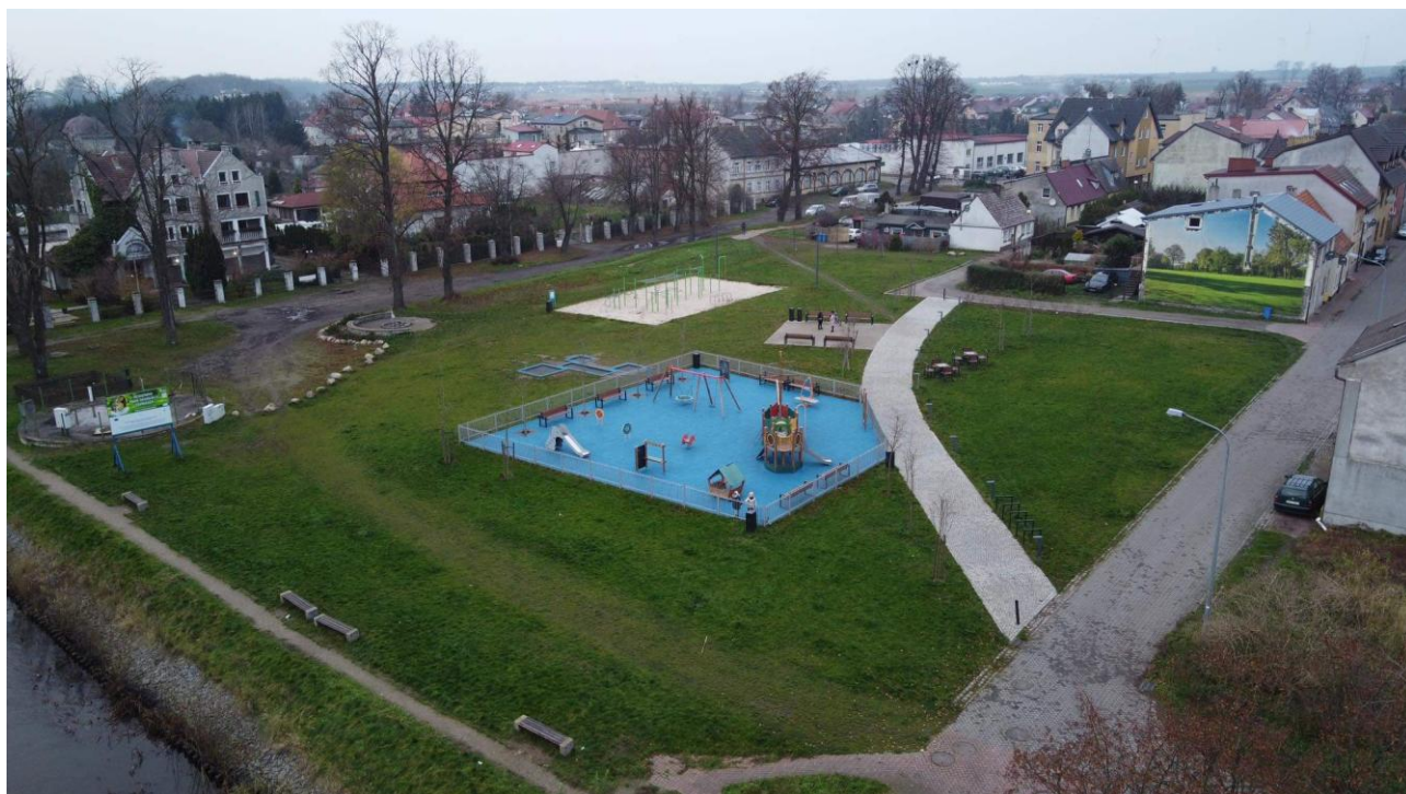
Zdjęcie nr 4. Zagospodarowany teren przy ul. Tragutta.