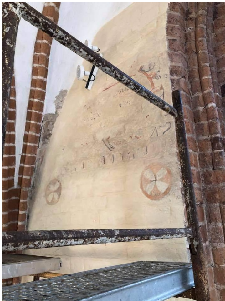
Zdjęcie nr 9. Odsłonięte średniowieczne freski.