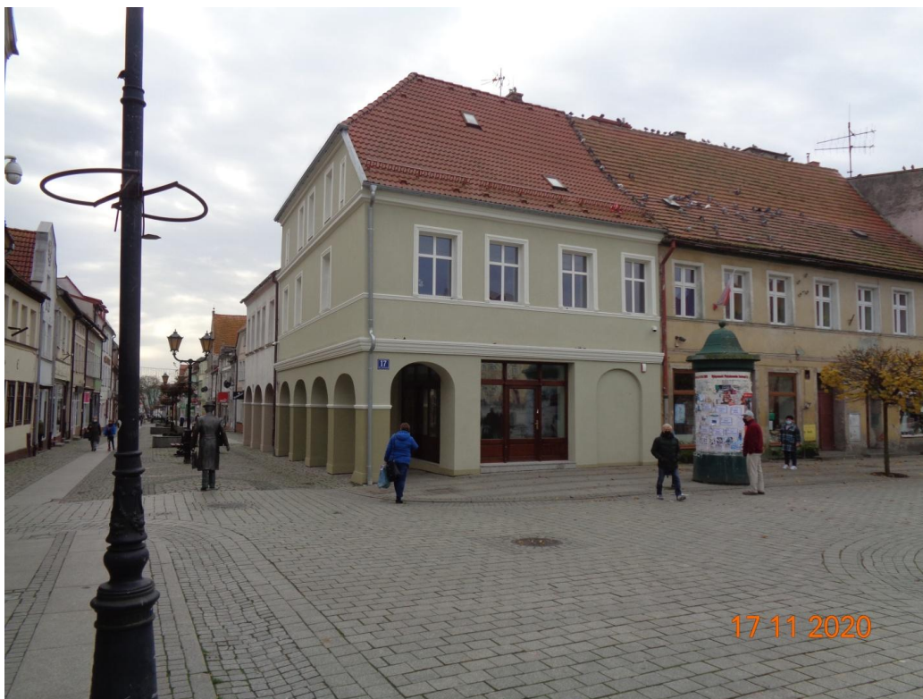
Zdjęcie nr 13. Dom z podcieniami Pl. T. Kościuszki 17 po pracach remontowych.