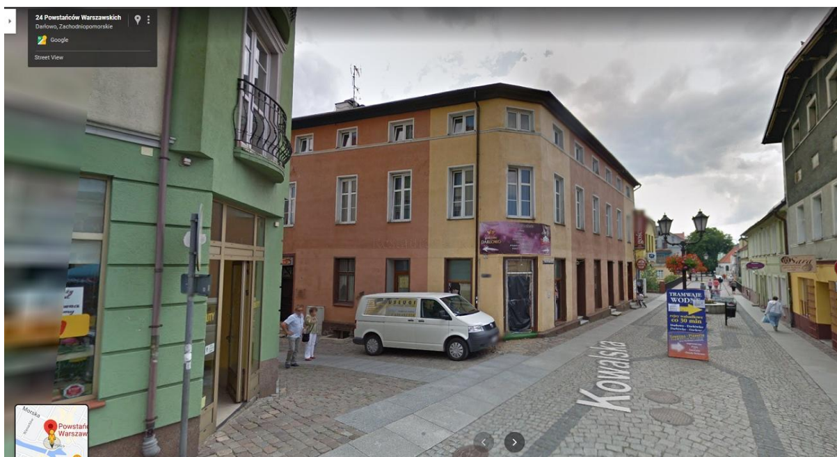
Zdjęcie nr 16. Kamienica przy ul. Powstańców Warszawskich 27 przed renowacją.