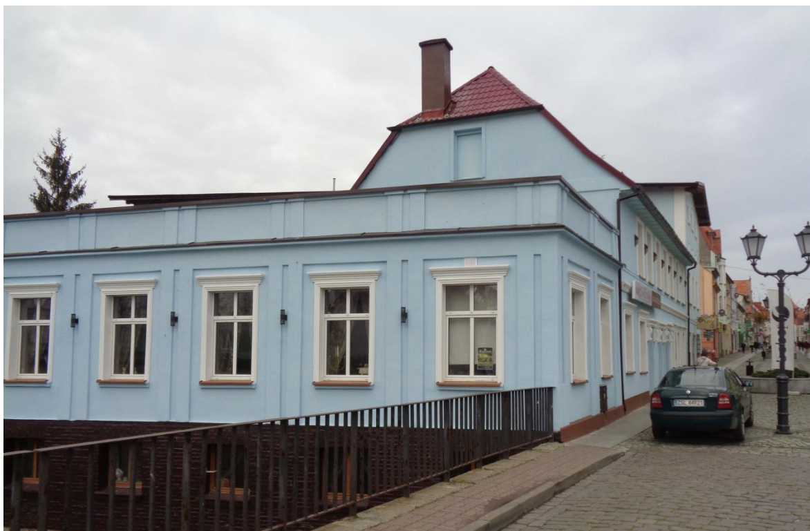
Zdjęcie nr 15. Kamienica usługowo-mieszkalna przy ul. Powstańców Warszawskich 26 po remoncie.