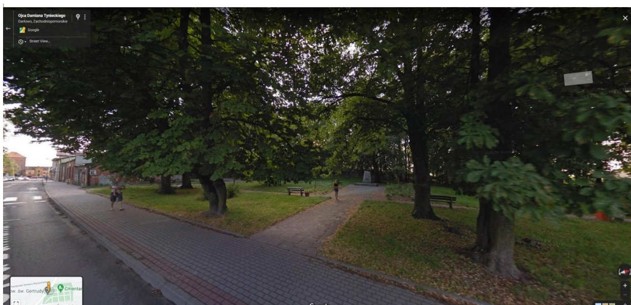
Zdjęcie nr 7. Otoczenie parku Króla Eryka przed inwestycją.