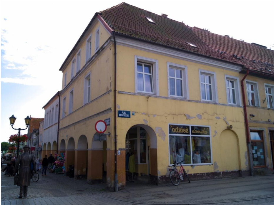
Zdjęcie nr 12. Dom z podcieniami przy Placu Tadeusza Kościuszki 17 przed pracami konserwatorskimi.