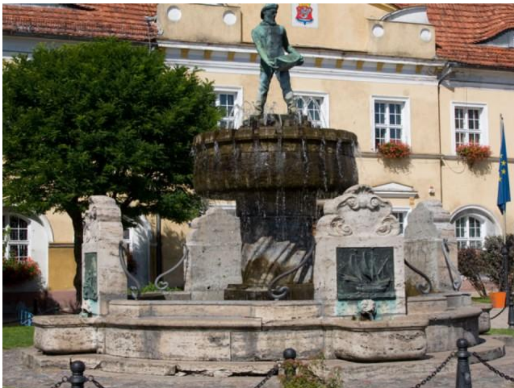
Zdjęcie nr 5. Pomnik rybaka przed pracami konserwatorskimi.

Koszt prac wyniósł 242.125,95 zł z budżetu Miasta Darłowo.