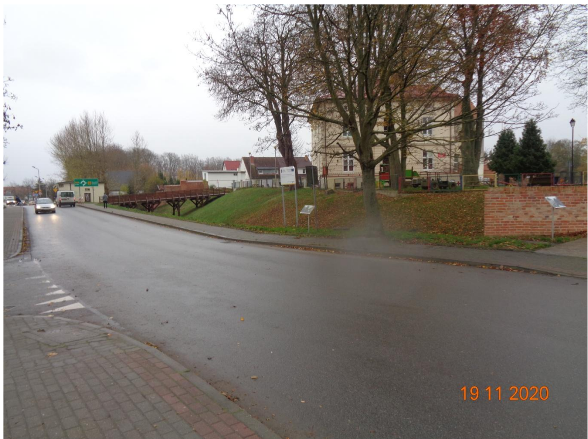
Zdjęcie nr 2. Otoczenie zamku po wykonaniu rekonstrukcji niektórych obiektów.