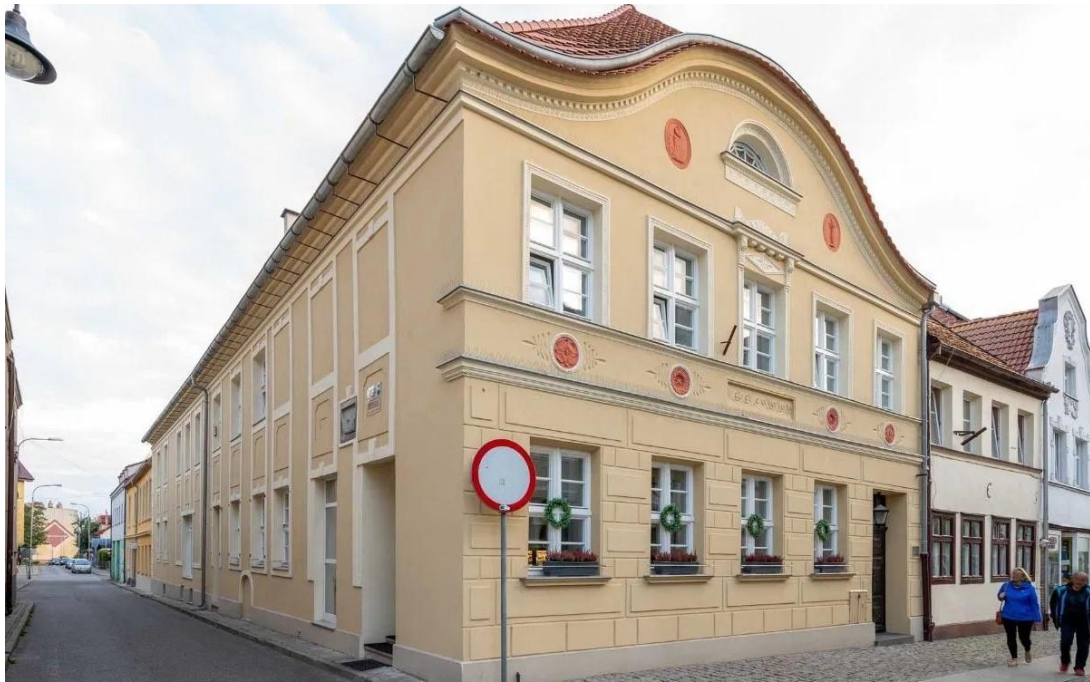
Zdjęcie nr 11. kamienica „Pod Kogą” po pracach renowacyjnych.